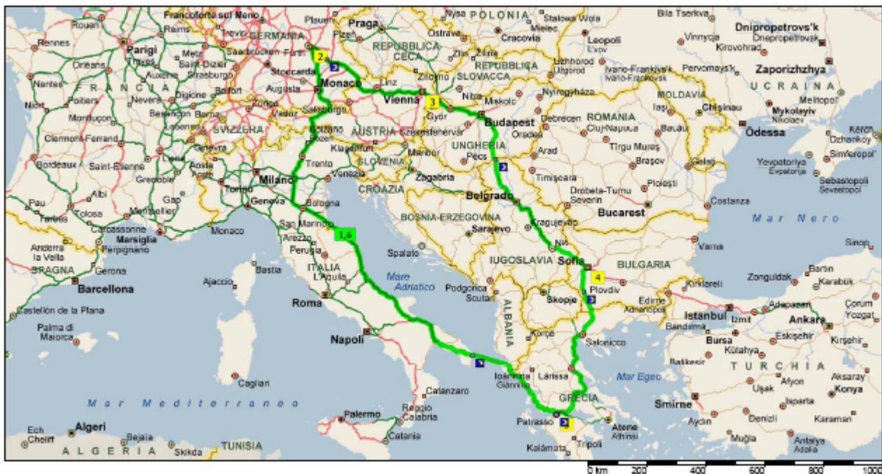
Fig.8. Il Ring continentale Rimini-Norimberga-Vienna-Sofia-Patrasso-Rimini.

industrielles. Les toponymes originaux et pleins de fantaisie nous reportent sûrement aux inscriptions qui devaient apparaître sur les écriteaux des auberges et des bistros, où le voyageur pouvait trouver nourriture et logement le long de son chemin. Les distances sont exprimées en milles, avec les chiffres romains. Les différents parcours routiers trouvent leur centre de rencontre et de ramification dans les villes principales: au-delà de Rome, Constantinople et Antioche, Ravenne et les quatre villes orientales de Thessalonique, Nicea, Nicomedia et Ancyra.